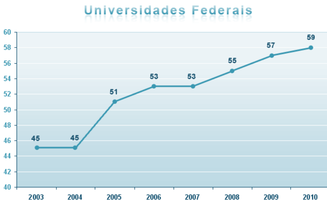
Mapa da Expansão das Universidades e Institutos Federais

Com o Programa de Apoio a Planos de Reestruturação e Expansão das Universidades Federais (Reuni), o governo federal adotou uma série de medidas para retomar o crescimento do ensino superior público, criando condições para que as universidades federais promovessem a expansão física, acadêmica e pedagógica da rede federal de educação superior. Os efeitos da iniciativa podem ser percebidos pelos expressivos números da expansão, iniciada em 2003. As ações do programa contemplam o aumento de vagas nos cursos de graduação, a promoção de inovações pedagógicas e o combate à evasão, entre outras metas que têm o propósito de diminuir as desigualdades sociais no país.