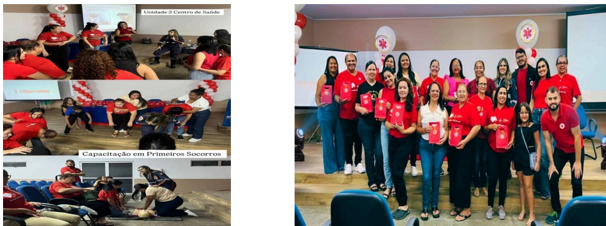
Figura 1 – Simulação das práticas realizadas e entrega de pocket masks: (Fonte: Acervo Pessoal, 2024)